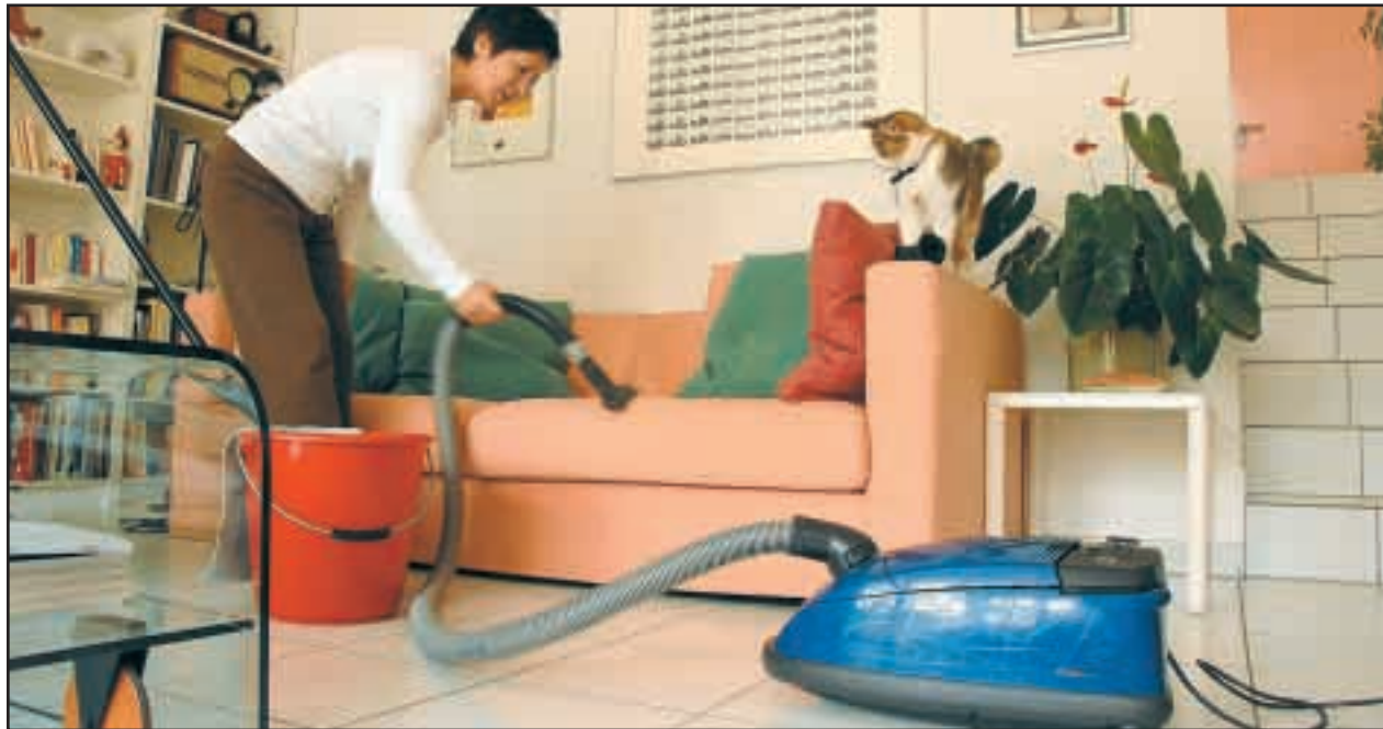
«Cette fois, je déclare ma femme de ménage»: l'intention est louable, mais gare aux surprises...

La facture pour l'employeur bondit à 451 francs par mois, soit 83 francs de plus. Une belle somme. Et Rosita reçoit moins, puisque l'impôt